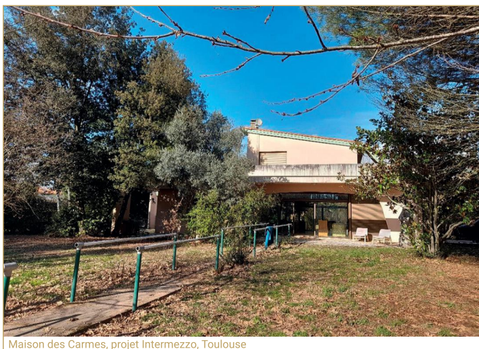
Maison des Carmes, projet Intermezzo, Toulouse

Le type d'accueil et d'accompagnement mis en place avec Intermezzo, plaçant la personne au centre de l'action et en répondant à ses besoins primaires notamment en matière de sommeil, lui permet d'autoréguler ses consommations autour de sa zone de confort. Renouer avec ses compétences et trouver une continuité dans son quotidien participe aussi des discussions complémentaires sur la polyconsommation.